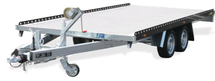
Universaltransporter Typ PU 3542-13-2040 Kastenmaße innen: L/B 4260 x 2040 mm zGG*: 3500 kg Nutzlast: ca. 2725 kg Bereifung: 195/50 R13C