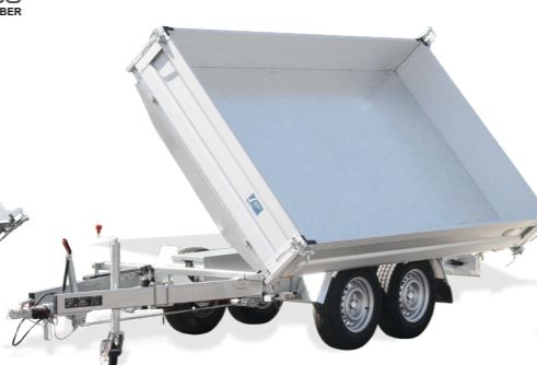
Dreiseitenkipper Typ UDK 3030-14-1750 Stahlboden und Winkelhebelverschlüsse, Elektro-Hydraulik, Nothandpumpe Kastenmaße innen: L/B/H 3060 x 1750 x 350 mm zGG*: 3000 kg Nutzlast: ca. 2310 kg Bereifung: 185 R14C 8PR