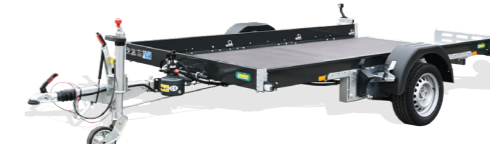
Absenkanhänger Typ AS 1426-13-1550 Kastenmaße innen: L/B/H 2600 x 1550 x 150 mm zGG*: 1400 kg Nutzlast: ca. 1030 kg Bereifung: 195/50 R13C