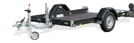
Absenkanhänger Typ AS 826-13-1550 Kastenmaße innen: L/B/H 2600 x 1550 x 150 mm zGG*: 750 kg Nutzlast: ca. 515 kg Bereifung: 175/70 R13