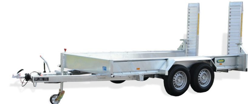
Baumaschinenanhänger Typ UBA 3536-14-1800 Kastenmaße innen: L/B/H 3660 x 1800 x 300 mm zGG*: 3500 kg Nutzlast: ca. 2730 kg Bereifung: 185 R14C 8PR