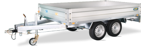
Pritschenhochlader Typ GTP 2630-14-1750 Kastenmaße innen: L/B/H 3060 x 1750 x 350 mm zGG*: 2600 kg Nutzlast: ca. 2100 kg Bereifung: 185/65 R14