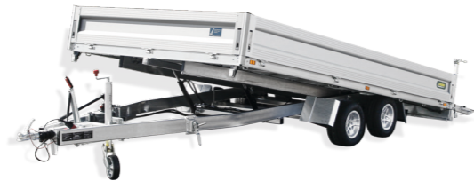
Pritschenhochlader kippbare Ladefläche Typ PKL 3042-10-2040 Kastenmaße innen: L/B/H 4260 x 2040 x 350 mm zGG*: 3000 kg Nutzlast: ca. 2190 kg Bereifung: 195/55 R10 AF