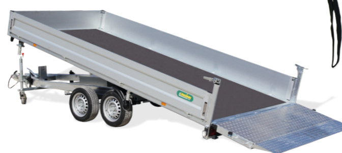
Maschinentransporter / Kipper Typ DUO 3542-13-2040 Windenbock, Elektrohydraulik, Funkfernbedienung Kastenmaße innen: L/B/H 4260 x 2040 x 350 mm zGG*: 3500 kg Nutzlast: ca. 2410 kg Bereifung: 195/50 R13C