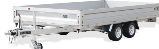
Pritschenhochlader Typ GTP 2642-10-2040 Kastenmaße innen: L/B/H 4260 x 2040 x 350 mm zGG*: 2600 kg Nutzlast: ca. 2030 kg Bereifung: 195/55 R10C AF