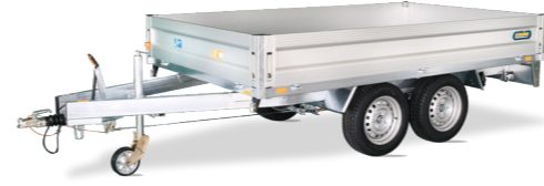
Pritschenhochlader Typ GTP 2636-14-1750 Kastenmaße innen: L/B/H 3660 x 1750 x 350 mm zGG*: 2600 kg Nutzlast: ca. 2070 kg Bereifung: 185/65 R14