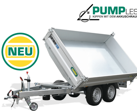
Dreiseitenkipper Typ UDK 2627-14-1500 Stahlboden und Winkelhebelverschlüsse, Pumpless Hydraulik Kastenmaße innen: L/B/H 2760 x 1500 x 350 mm zGG*: 2600 kg Nutzlast: ca. 1960 kg Bereifung: 185/65 R14