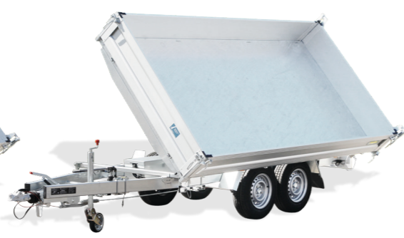
Dreiseitenkipper Typ UDK 3536-14-1750 Stahlboden und Winkelhebelverschlüsse, Elektro-Hydraulik, Nothandpumpe Kastenmaße innen: L/B/H 3660 x 1750 x 350 mm zGG*: 3500 kg Nutzlast: ca. 2630 kg Bereifung: 185 R14C 8PR