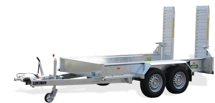
Baumaschinenanhänger Typ UBA 3030-14-1600 Kastenmaße innen: L/B/H 3060 x 1600 x 300 mm zGG*: 3000 kg Nutzlast: ca. 2380 kg Bereifung: 185 R14C 8PR