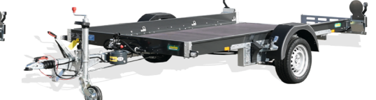
Absenkanhänger Typ AS 1837-13-1800 Kastenmaße innen: L/B/H 3750 x 1800 x 150 mm zGG*: 1800 kg Nutzlast: ca. 1310 kg Bereifung: 195/50 R13C